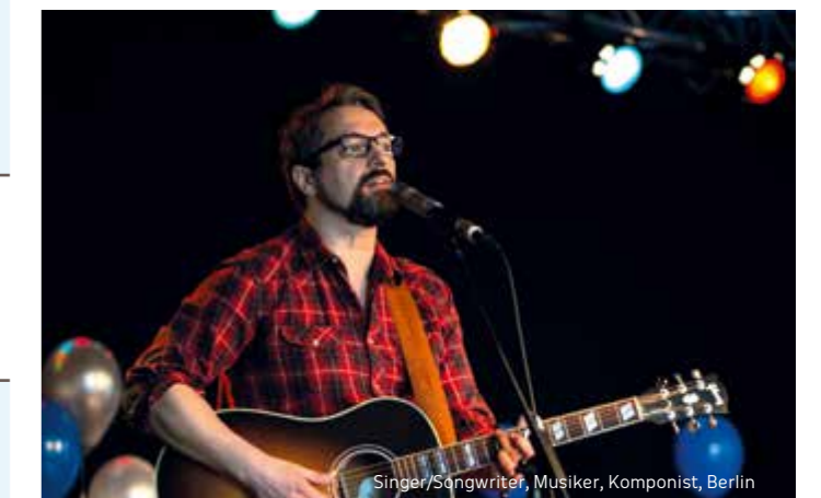
Singer/Songwriter, Musiker, Komponist, Berlin

Änderungen vorbehalten! Die Termine der Referent/innen und Musiker/innen wurden mit Sorgfalt abgestimmt. Dennoch kann es vorkommen, dass ein Wechsel notwendig wird. Die aktuellste Fassung des Programms ist jederzeit auf der Homepage unter www.pinea-programm.de einzusehen.